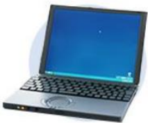
ノートブックパソコン