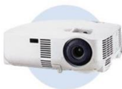
液晶プロジェクター